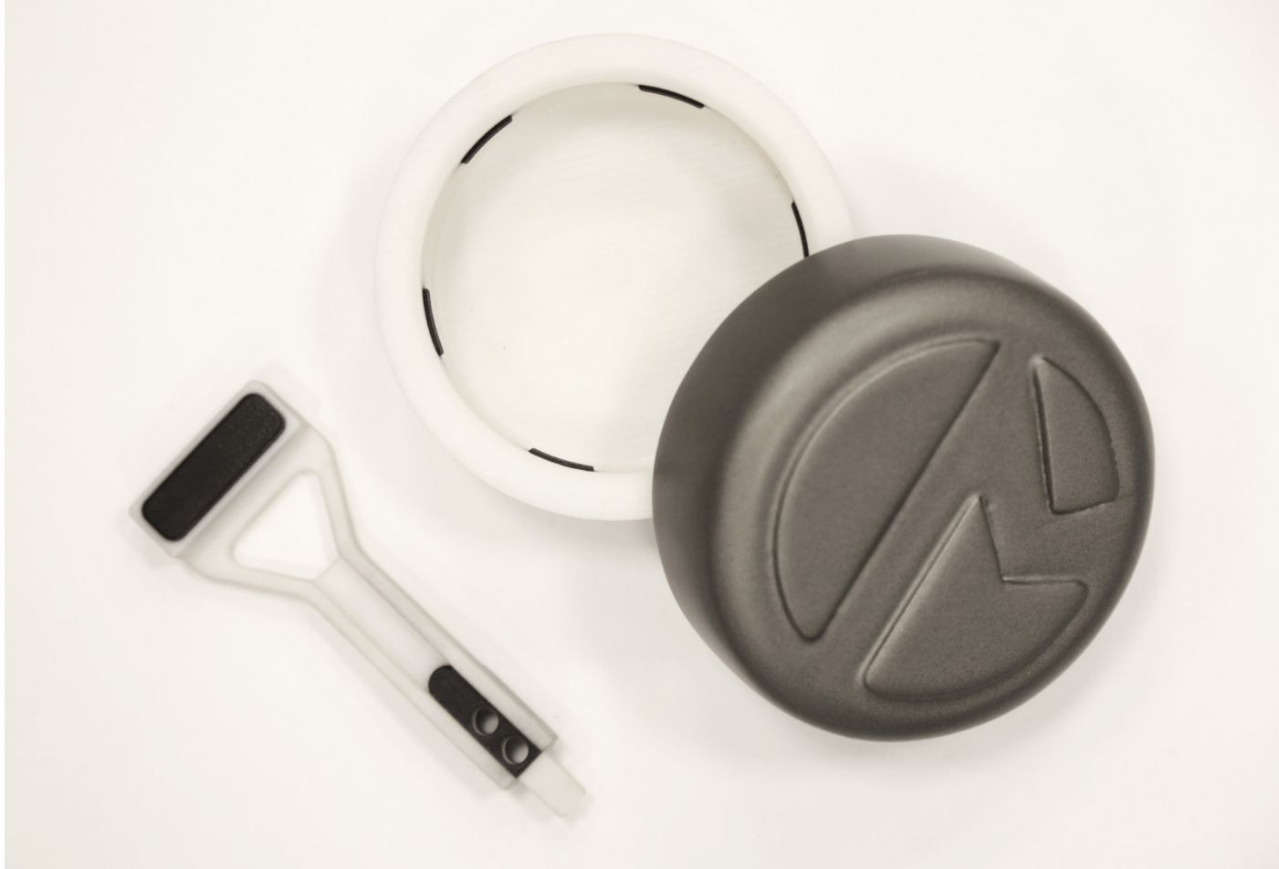
Una pinza da presa (a sinistra) e il coperchio dell'imballaggio (a destra), stampati in 3D con tecnologia Stratasys PolyJet. La stampa 3D multimateriale è stata utilizzata per creare i componenti strutturali bianchi e le impugnature in gomma nera all'interno di un unico processo.

Marchesini Group sta utilizzando la tecnologia PolyJet di Stratasys anche per produrre parti e componenti per applicazioni che richiedono la combinazione di due o più materiali. "Un ottimo esempio di questa tecnologia è la produzione di pinze da presa progettate per la manipolazione di oggetti leggeri come i foglietti illustrativi o i vasetti più piccoli. Con l'avanzata capacità di stampa 3D multi-materiale, possiamo realizzare design complessi che uniscono materiali duri ad altri simili alla gomma in un'unica stampa, cosa che in genere richiederebbe processi multipli, con un costo maggiore in termini di tempo e denaro", ha aggiunto Fortunati.