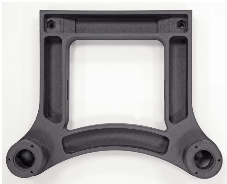
Componente stampato in 3D utilizzato per la movimentazione dei prodotti sul sistema di confezionamento robotizzato. Prodotto utilizzando il materiale FDM Nylon 12CF.

La fabbricazione additiva si è rivelata particolarmente importante per diverse applicazioni chiave nei macchinari industriali per il confezionamento robotizzato, tra cui involucri di protezione, sistemi di supporto dei cavi e scatole